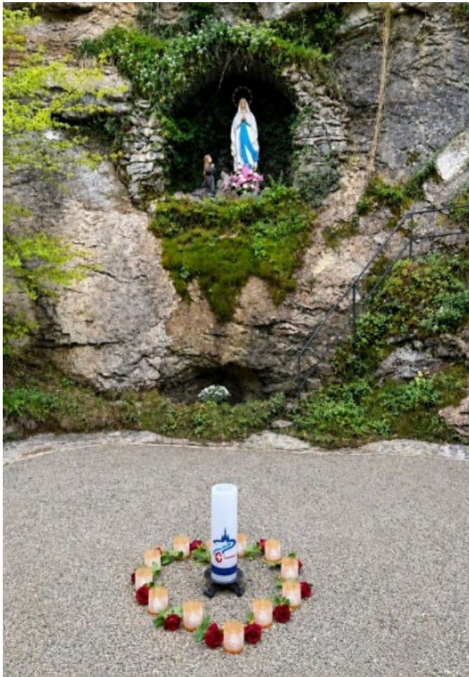
Bild: Lourdesgrotte in Illgau

Fürs anschliessende Essen im HügelCafe ist eine Anmeldung notwendig bis Freitag, 19.06.2026 , entweder per Mail info@schwyzer- lpv.ch oder per Tel. 079 545 19 31.